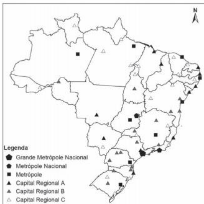
BRASIL. IBGE. Regiões de influência de cidades 2007. Rio de Janeiro: IBGE, 2008 (adaptado).

O critério que rege a hierarquia urbana é a